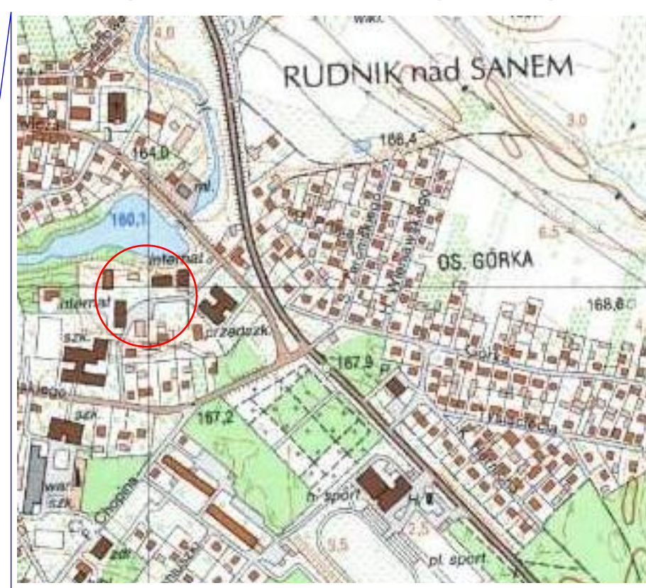
ORIENTACJA 1 : 10 000